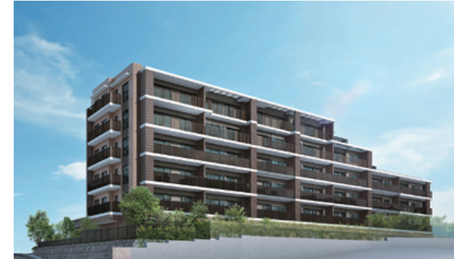
グランフォーレ平尾四丁目レジデンス (29戸) 2020年1月完成 福岡市中央区