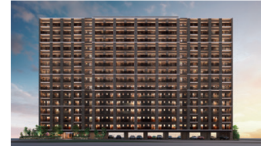
(グランフォーレ千早プレミア)

当社グループは、ファミリーマンション及び資産運用型マンションの販売を継続して行うとともに、新規物件の開発に取り組むことができました。この結果、売上高9,055,069千円（前期比25.5%減）、営業利益624,379千円（前期比59.7%減）、経常利益643,547千円（前期比58.3%減）、親会社株主に帰属する当期純利益425,658千円（前期比58.2%減）となりましたが、福岡市や長崎市、東京都で計6棟のマンションを完成させ、中古物件を合わせて388戸を引き渡すことができました。