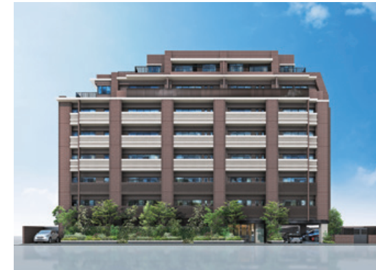
グランフォーレ大橋サウステラス (34戸) 2020年2月完成 福岡市南区