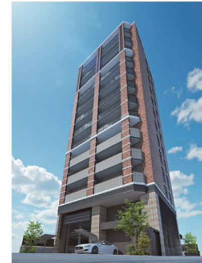
グランフォーレ五島町レジデンス (22戸) 2020年12月完成予定 長崎県長崎市