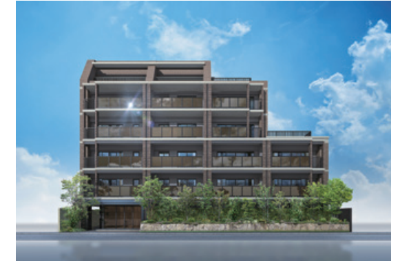
グランフォーレ春日宝町 (28戸) 2020年1月完成 福岡県春日市